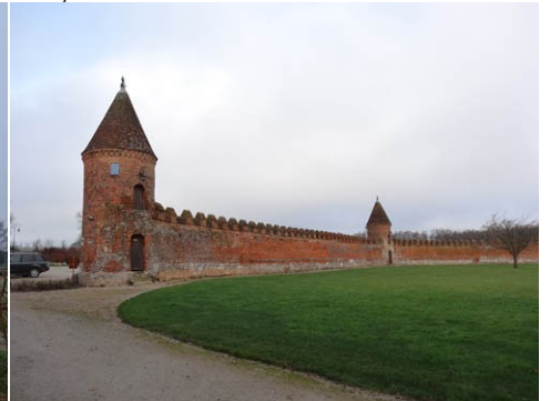
L'ancienne enceinte intégrée au château