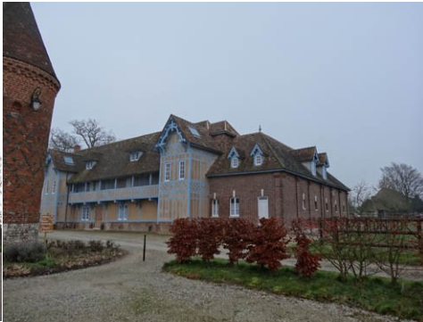
Les dépendances à colombage