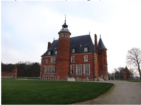
La façade ouest du château