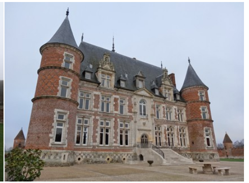
La façade est du château