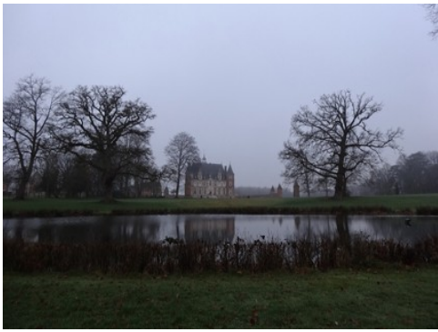
La façade est du château (vue éloignée)