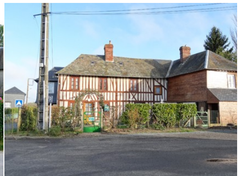
Quelques maisons dans les abords