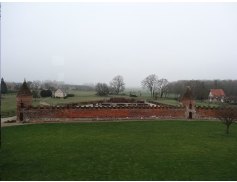
La vue vers l'ouest